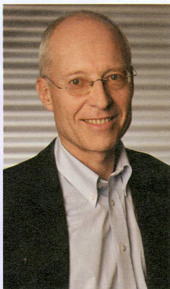
Dr. med. Rüdiger Dahlke